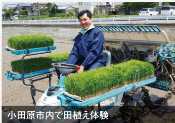
小田原市内で田植え体験

田植え作業を体験。営農のご苦労を伺い、営農者、農業を守る大切さを実感しました。神奈川県らしい都市農業の発展に貢献できるよう頑張ります。