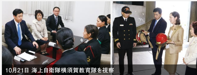
10月21日 海上自衛隊横須賀教育隊を視察

海上自衛隊女性隊員と懇談。出産や子育てなど育児と任務の両立、キャリアプランなど、幅広く意見を交換しました。後輩にとって先輩が良き相談相手、隊員相互に子供の面倒を見たりしているなど、実際の現場を知ることができました。託児所の充実など、女性活躍環境の拡充を強力に推進することを誓いました。