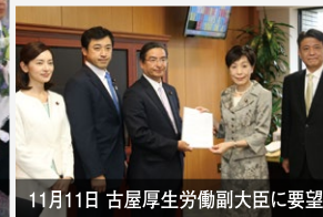
11月11日 古屋厚生労働副大臣に要望