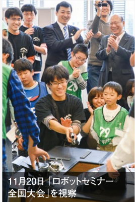
11月20日「ロボットセミナー全国大会」を視察

学生のロボット大会を視察。科学技術立国・日本を目指し、未来の技術者、科学者を全力で応援していきます。