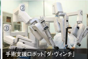
手術支援ロボット「ダ・ヴィンチ」

手術支援ロボット「ダ・ヴィンチ」を視察。患者のみならず、医師への負担も減らせる技術。医工連携で命を守る社会構築へ、決意を新たにしました。