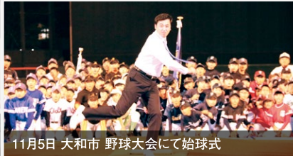
11月5日 大和市 野球大会にて始球式