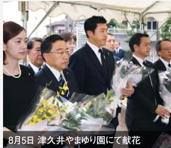
8月5日 津久井やまゆり園にて献花

再発防止の提言を古屋厚生労働副大臣に申し入れ。共生社会の実現に全力で取り組み、悲惨な事件が二度と起こらないようにします。