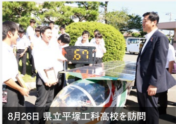
8月26日 県立平塚工科高校を訪問

ソーラーカーレース鈴鹿2016にて7連覇を果たしたマシンを囲み学生と対話。ここに「日本のものづくりの原点」があると感じました。