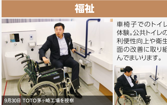
9月30日 TOTO茅ヶ崎工場を視察

車椅子でのトイレ体験。公共トイレの利便性向上や衛生面の改善に取り組んでまいります。