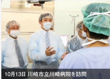
10月13日 川崎市立川崎病院を訪問