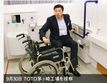
9月30日 TOTO茅ヶ崎工場を視察

車椅子でのトイレ体験。公共トイレの利便性向上や衛生面の改善に取り組んでまいります。