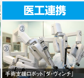
手術支援ロボット「ダ・ヴィンチ」

手術支援ロボット「ダ・ヴィンチ」を視察。患者のみならず、医師への負担も減らせる技術。医工連携で命を守る社会構築へ、決意を新たにしました。