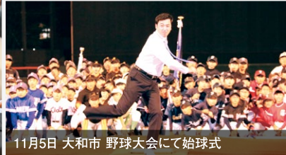
11月5日 大和市 野球大会にて始球式

学生のロボット大会を視察。科学技術立国・日本を目指し、未来の技術者、科学者を全力で応援していきます。