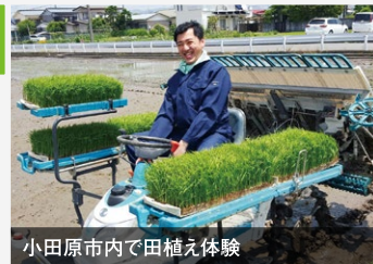
小田原市内にて田植え体験

田植え作業を体験。営農のご苦勞を伺い、営農者、農業を守る大切さを実感しました。神奈川県らしい都市農業の発展に貢献できるよう頑張ります。