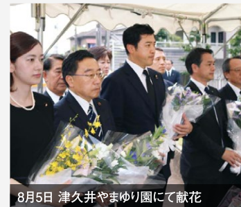
8月5日 津久井やまゆり園にて献花

再発防止の提言を古屋厚生労働副大臣に申し入れ。共生社会の実現に全力で取り組み、悲惨な事件が二度と起こらないようにします。