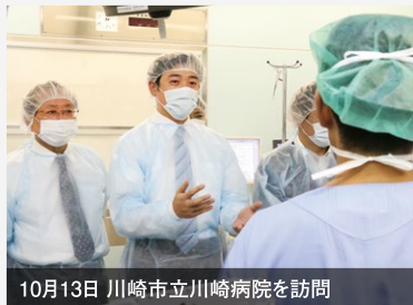
10月13日 川崎市立川崎病院を訪問