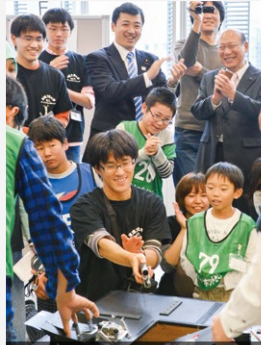
11月20日「ロボットセミナー 全国大会」を視察

学生のロボット大会を視察。科学技術立国・日本を目指し、未来の技術者、科学者を全力で応援していきます。