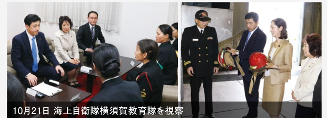
10月21日 海上自衛隊横須賀教育隊を視察

海上自衛隊女性隊員と懇談。出産や子育てなど育児と任務の両立、キャリアプランなど、幅広く意見を交換しました。後輩にとって先輩が良き相談相手、隊員相互に子供の面倒を見たりしているなど、実際の現場を知ることができました。託児所の充実など、女性活躍環境の拡充を強力に推進することを誓いました。