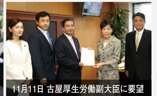
11月11日 古屋厚生労働副大臣に要望

再発防止の提言を古屋厚生労働副大臣に申し入れ。共生社会の実現に全力で取り組み、悲惨な事件が二度と起こらないようにします。